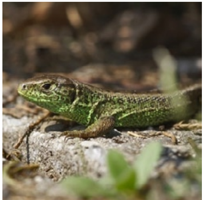
Die Zauneidechse braucht geeignete Steinhäufen als Unterschlupf.