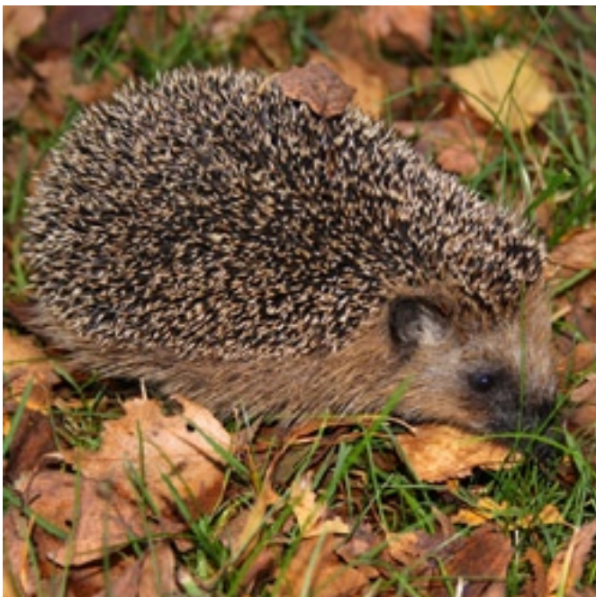
Für seinen Winterschlaf benötigt der Igel Ast- und Laubhaufen.