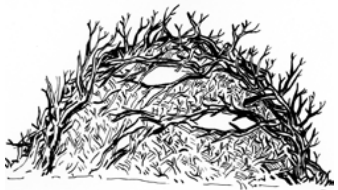
Asthaufen: Beim Bau sollte grobes und feines Material verwendet werden. (Illustration: Martin Chramosta)