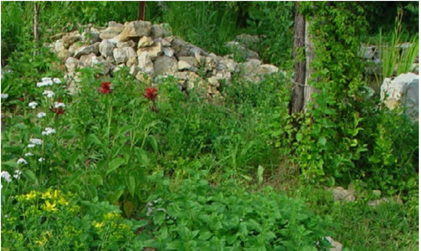
Gärten mit verschiedenen Strukturen und etwas „Unordnung“ sind sehr wertvoll für die Natur.

Die Vielfalt, die unsere Fauna und Flora ausmacht, schwindet vielerorts. Gärten können – gerade mitten in Siedlungsgebieten – naturnahen Lebensraum für viele Insekten und andere Kleintiere schaffen. Wer in seinem Garten naturnahe Kleinstrukturen anlegt, fördert die Biodiversität. Und wird belohnt mit einer lebendigen Fläche, in der sich viel Interessantes beobachten lässt.